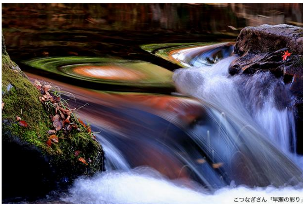
こつなぎさん「早瀬の彩り」